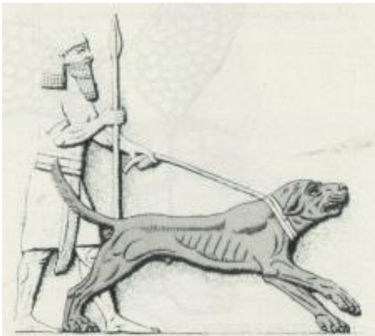
Alexander Veľký a Peritas

Alexander Veľký, macedónsky kráľ (356 - 323 p.n.l.), dostal od indického kráľa Sopieta sto päťdesiat šesť bojovo vycvičených psov. V bitke sa mali tieto psi zahryzovať do nozdier nepriateľských koní a mali strhávať jazdcov zo sediel. Ibaže Alexandrove psi neznamenali pre staroveký svet, najmä nie pre ázijských bojovníkov, vôbec žiadny objav. Vojnové a ťažké lovecké psi totižto svojimi tlapami stúpali prach ázijských ciest a stepí najmenej dve tisícročia pred Alexandrom. V roku 326 p.n.l. porazil Alexander Veľký indického kráľa Porosa. Ušetril jeho život aj majetok a kráľ mu na oplátku venoval svorku psov. Alexander však v bitke stratil svojho obľúbeného psa - Peritasa. Plutarchos tvrdí, že na počesť tohoto psa potom bolo pomenované novozaložené mesto Cynopolis. Z tejto vojnenej výpravy potom priviedol Alexander Veľký veľké množstvo psov do Macedónska a Epeira.